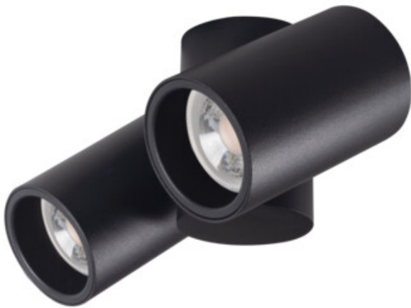
BLURRO 2xGU10 CO-B